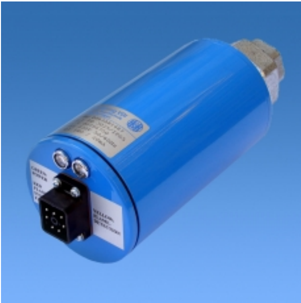
UV-Flammenwächter FD 3025

Die Flammenerfassung erfolgt über eine mechanisch geschutterte UV-Röhre der Type P607-8 oder vergleichbare, wie in EN 298 Kap. 7.4.2 gefordert. Der zur Selbstüberwachung erforderliche Prüfablauf wird beim ersten Erkennen eines Flammensignals sowie nachfolgend [Produktdetails...]